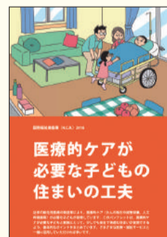
医療的ケアが必要な 子どもの住まいの工夫