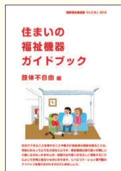
住まいの福祉機器 ガイドブック