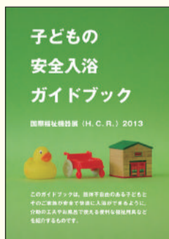
子どもの安全入浴 ガイドブック