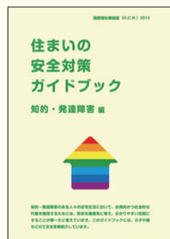
住まいの安全対策 ガイドブック